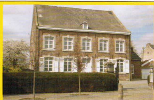
De pastorie blijft ter beschikking van de parochiale verenigingen.

Met het vertrek van de pastoor en vooral door het feit dat er geen nieuwe meer komt, kwam het gebouw, dat eigendom is van de stad, leeg te staan. De kerkfabriek kreeg het in erfpacht en kan het nu laten gebruiken door de parochiale verenigingen voor bestuurs- en werkvergaderingen en als archiefruimte. De stad krijgt hiervoor een vergoeding van 1 euro per jaar en staat in voor alle belastingen en taksen. De kerkfabriek zorgt voor onderhoud en herstellingen. Maar wat belangrijker is, onze verenigingen blijven onder dak !