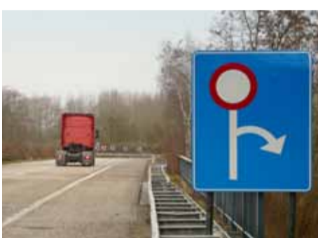
Er zal nog slechts 1/4 de van het verkeer via Melveren-Centrum passeren