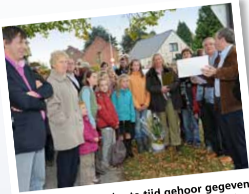
Zo wordt binnen korte tijd gehoor gegeven aan de petitie die vanuit het Schoolstraatcomité werd gevoerd