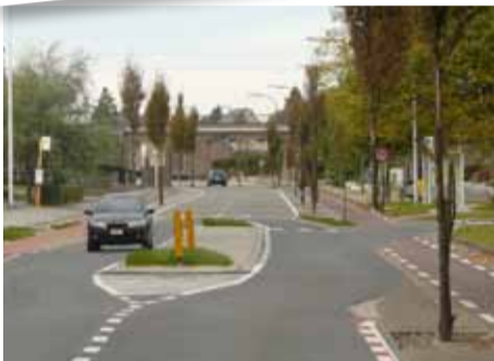
Een veilige oversteekplaats op Melveren-Centrum en de Hasseltsesteenweg ter hoogte van de Schoolstraat